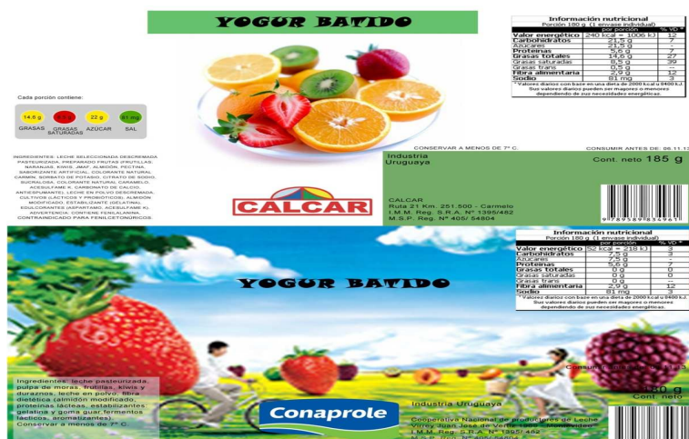
Figura 1. Ejemplo de un set de elección de dos etiquetas de yogures utilizadas en el estudio. La etiqueta superior muestra el Diseño B y la etiqueta inferior el Diseño A

A partir de las 32 etiquetas se generaron 16 sets de elección compuestos por dos etiquetas siguiendo un diseño factorial fraccionado ortogonal (Aizaki, 2012). En la Figura 1 se muestra un ejemplo de uno de los sets de elección utilizados en el estudio. En cada uno de los pares las posiciones de las etiquetas (superior o inferior) fue balanceada entre los participantes. Las etiquetas y los sets de elección fueron diseñadas usando GIMP 2.6.