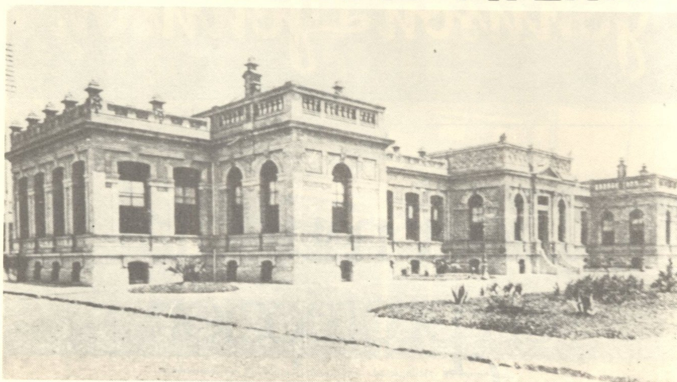
Instituto de Química.

Por Ley N° 55 de 8 de junio de 1833 se crea la Universidad, y se establecen en ella dos Cátedras de Medicina.