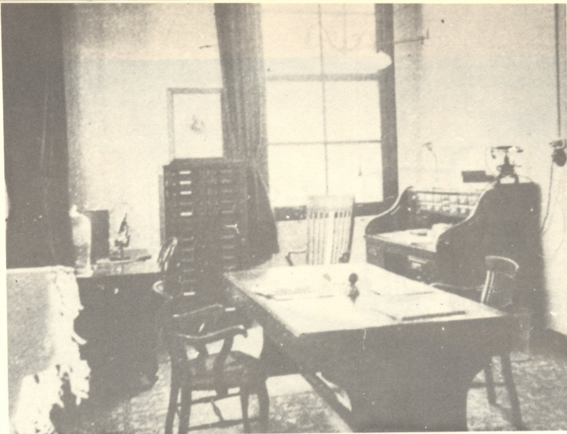
Instituto de Química. Despacho del Director.

sarrollo se hizo cada vez más amplio con la creación de nuevas cátedras y ayudantías como puede verse en la lista siguiente: