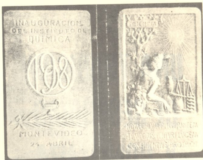
Medalla conmemorativa de la inauguración del Instituto de Química.

El Instituto desarrollaba una obra intensa y compleja. En él se dictaba la clase de Química biológica para los estudiantes de Medicina con demostraciones teóri-