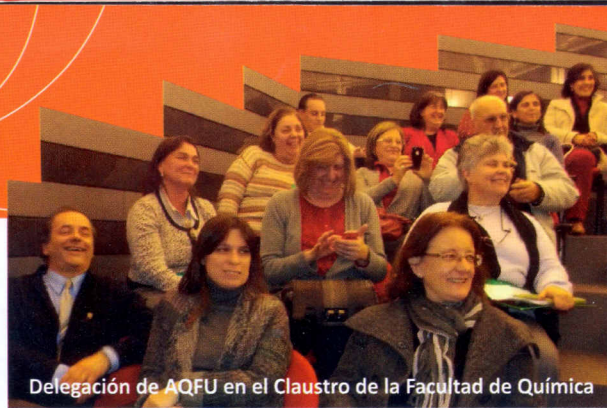
Delegación de AQFU en el Claustro de la Facultad de Química